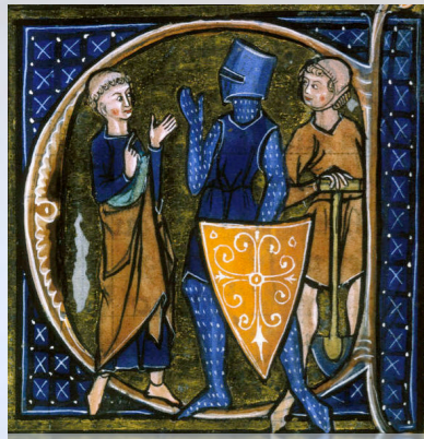
Från 500-1500 talet.